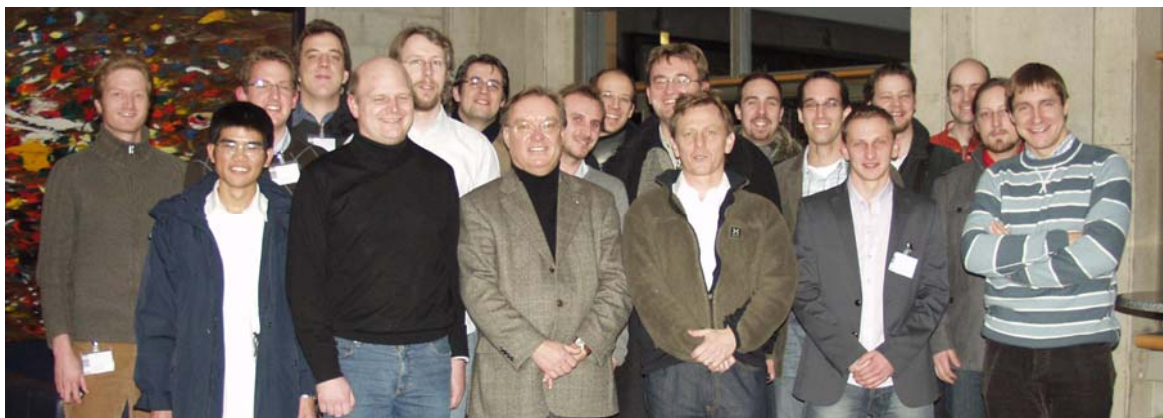
Die Teilnehmer des BMBF-Workshops INVERS in Bremen